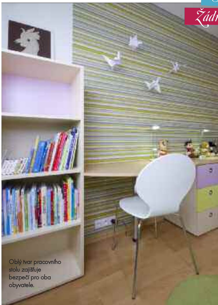
Oblý tvar pracovního stolu zajišťuje bezpečí pro oba obyvatele.

Obě děti mají rovnocenný prostor. Žádné z dětí nesmí být „v nevýhodě“.