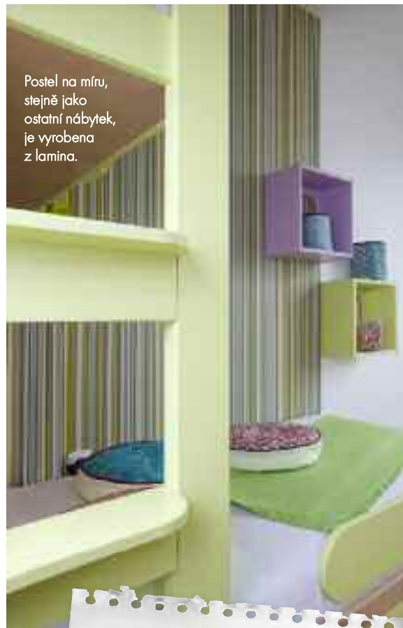
Postel na míru, stejně jako ostatní nábytek, je vyrobena z lamina.